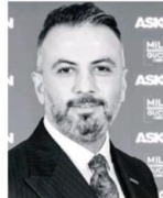
AYDIN: 14 çeyrek kesintisiz büyüyen Türkiye, sayılı ekonomiler arasında yerini aldı.

sektörüne verilecek destek, orta ve uzun vadede verimlilik artışına bağlı olarak potansiyel GSYH büyüme hızını arttıracak, ekonomide genel verimlilik ve istihdam artışını destekleyecektir. 2024 için makroekonomideki en önemli konu, enflasyon olmaya devam edecektir. Enflasyonla mücadelenin kararlı şekilde sürdürülmesini doğru buluyoruz. Sürdürülebilir büyüme için düşük enflasyon en önemli ön şarttır" dedi.