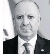
ARDIÇ: Sürdürülebilir büyüme için düşük enflasyon en önemli ön şarttır.