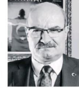
BARAN: Yapısal düzenlemeler Türkiye'nin kalkınma hızının artmasını sağlayacaktır.