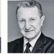
EREN: Yatırım programı yeni proje alınmadı. İnşaatla büyüme 2023 kadar olmaz.