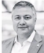
ÖKSÜZ: Vatandaşın büyümeden pay alabilmesi için ihracatımız daha güçlü olmalı.