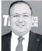
TECDELIOĞLU: Oranlar büyümede dengelemeye yönelik sürecin yürüdüğünü gösteriyor.